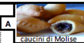
caucini di Molise

La presentazione completa è disponibile in due formati: una registrazione del programma dato al Incontro dantesco del 12 ottobre (narrato con immagine e testo minimale) e un Powerpoint con ampie descrizioni di testo e immagini.