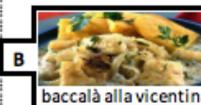
baccalà alla vicentina