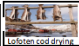
Lofoten cod drying