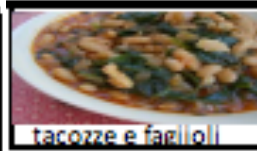
tacoze e fagioli