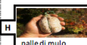
palle di mulo