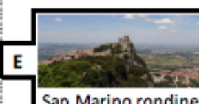
San Marino rondine