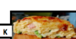
frittatina di pasta