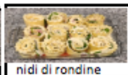
nidi di rondine