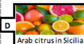
Arab citrus in Sicilia