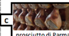
prosciutto di Parma